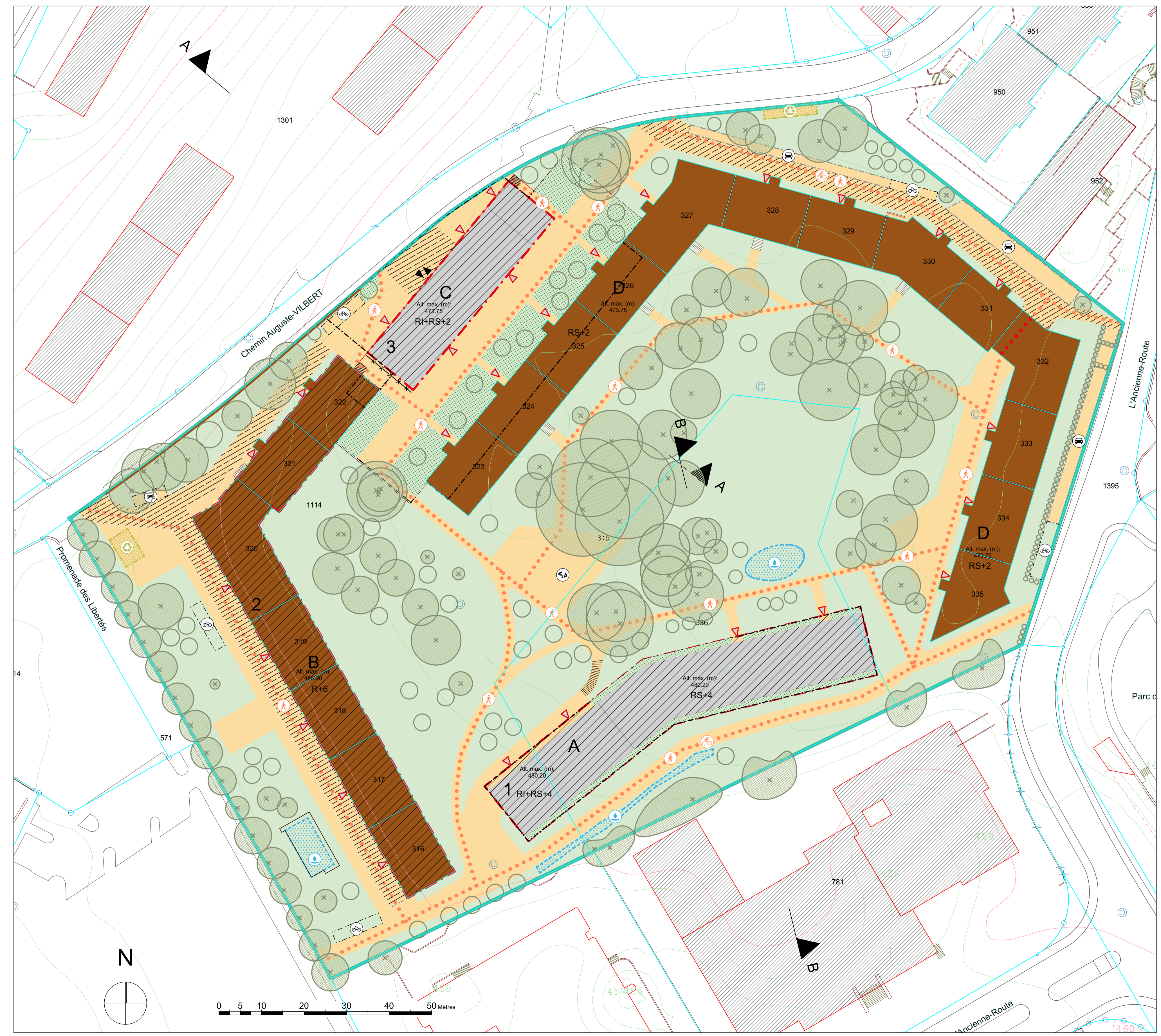
Plan d'équipement 1:1000