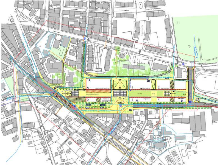
Le périmètre de la gare des Eaux-Vives a fait l'objet d'un plan directeur de quartier (29'520), adopté le 22 juillet 2009. Un plan localisé de quartier est aujourd'hui en cours de procédure.