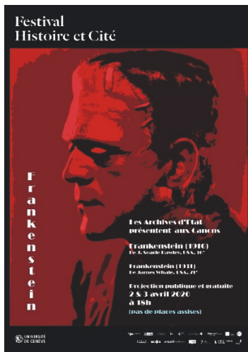
Le visiteur qui n'est jamais venu