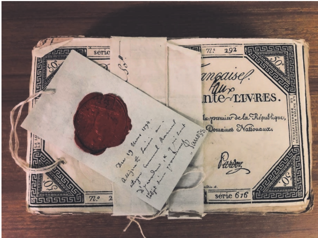
Fausse monnaie conservée dans une procédure judiciaire. Il s'agit de faux assignats ; l'assignat étant une monnaie de circulation et d'échange émis en France de 1789 à 1796. (AEG PC 17489)