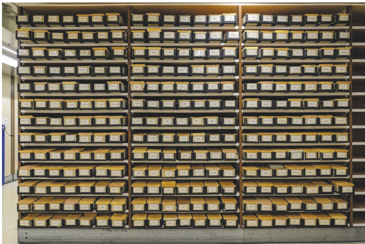
Fichier de l'office cantonal de la population