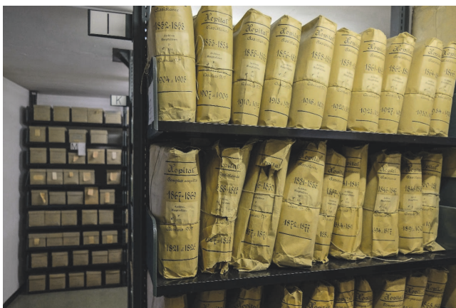
Dépôt du Soleil-Levant

Notons également la signature en septembre 2020 d'une convention avec les Hôpitaux universitaires de Genève (HUG). Cette nouvelle convention remplace les documents antérieurs et prend en compte le traitement des archives numériques.