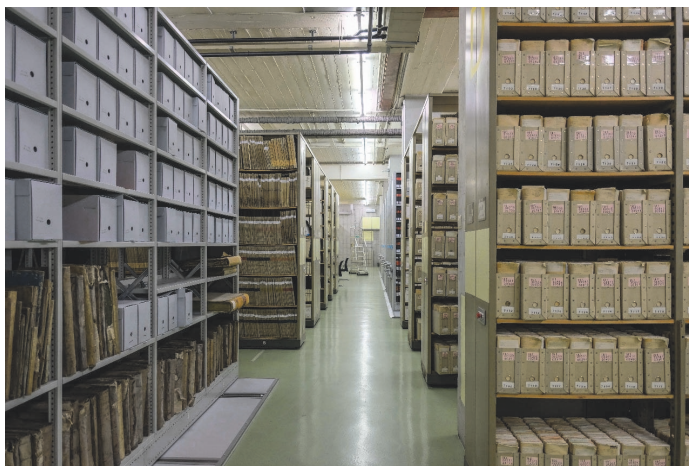
Dépôt des Maraichers

Les installations d'alarme, les éclairages de secours, le système de contrôle d'accès ainsi que les extincteurs ont été révisés dans le cadre des contrôles annuels dans tous les locaux, exception faite des installations de climatisation des dépôts de la Terrassière. Ces derniers sont reportés à 2021 en raison des mesures sanitaires. Toutes les têtes de détection incendie ont été remplacées au 1, rue de l'Hôtel-de-Ville ainsi que dans le bâtiment du Soleil-Levant.