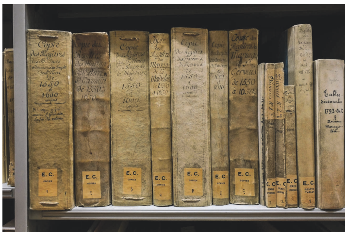
Registres de paroisses, Ancien Arsenal

Ces trois médias comptabilisent 1900 abonnés.