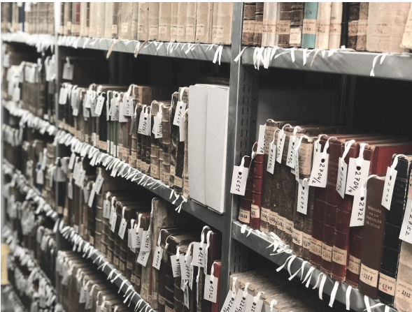
Dépôt du Soleil-Levant, bibliothèque : aperçu d'un système d'étiquetage favorisant la préservation des livres anciens

15 messages ont été envoyés aux 1121 personnes inscrites (par le biais de leur visite en salle de lecture ou par celui du site internet) pour recevoir des informations sur les activités des AEG.