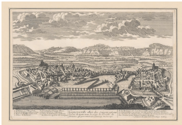
Vues de Genève : Genève ville alliée des Suisses est sur le Lac de même nom, le siège de l'Évêché de Genève est présentement à Annecy en Savoie, par Aveline, 1670 CH AEG Archives privées 247/I/13

Les scanners ont connu de nombreux problèmes dus notamment à la migration en Windows 10 de tous les postes de l'État de Genève (PTE), de même qu'à des ennuis mécaniques apparus sur le scanner acquis en 2018. Plusieurs réunions ont eu lieu à ce sujet en présence de toutes les parties prenantes, à savoir les AEG, le service organisation et sécurité de l'information (OSI) de la Chancellerie, l'office cantonal des systèmes d'information et du numérique (OCSIN), ainsi que l'entreprise SUPAG (fournisseur des scanners). Une partie des problèmes identifiés a pu être résolue en fin d'année. Il convient de relever que les campagnes de numérisation ont grandement souffert de cette situation.