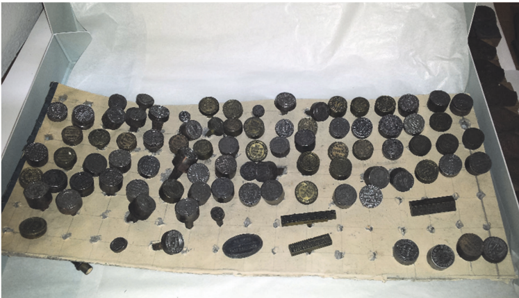
Anciennes matrices officielles de sceaux de l'État de Genève, reconditionnées

Les interventions massives de ré-étiquetage et de reconditionnement menées depuis la fin de l'année 2017 améliorent durablement la gestion des dépôts et faciliteront le futur déménagement.