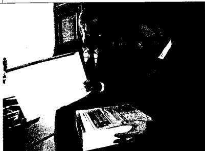
PÉTITION Werner De Schepper, rédacteur en chef du Blick , remettant les 175 000 signatures anti-molosses à Joseph Deiss en décembre 2005.