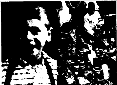
SULEYMAN La mort du bambin d'Oberglatt (ZH) et l'émotion qui a suivi sont à l'origine des débats actuels sur les chiens de combat.