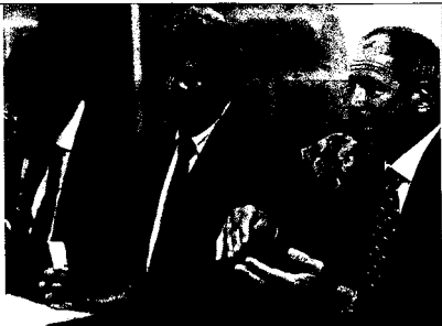
GENÈVE EN FOLIE Conférence de presse surréaliste le 21 août dernier, avec trois membres du gouvernement pour parler des chiens.