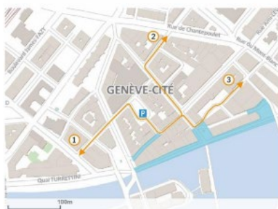
Situation actuelle, avec trois sorties du parking MANOR: