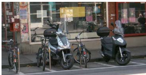
Figure 5: Un écartement de 1m entre deux épingles n'empêche pas un scooter d'y stationner (24, bd Carl-VOGT, Juillet 2007)