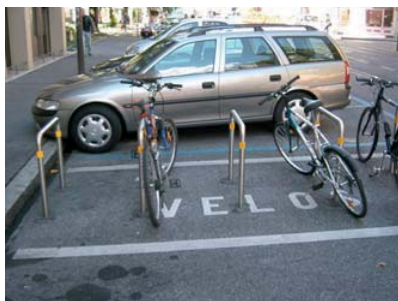
Figure 6: Espèce rare : place de stationnement dédiée au vélo sur la chaussée (en face du 17, pl. des Augustins, Juillet 2007)

En Ville de Genève, on trouve très peu de places dédiées aux vélos sur la chaussées (espace avec indication « Vélos »). Il n'est pas très clair si ces places ont une existence légale ou non. Quoi qu'il en soit, en l'absence d'épingles, elles sont considérées par les usagers comme des places de stationnements deux-roues standard : on y trouve aussi bien des vélos que des 2RM.