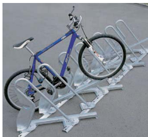
Figures 7 et 8 : PédalParc®basic (gauche) et PédalParc®flexo (droite)

Outre le fait de réserver l'espace aux seuls vélos, les avantages de ce type de râteliers fabriqués par la société Vêlopa sont de ranger les vélos alignés et de manière assez compacte (un tous les 45cm) et de permettre d'attacher le vélo directement au support. Ceci, même si tous les vélos ne sont pas garés correctement avec l'axe de la pédale dans la fente. D'autre part, ils sont simples à installer (quelques trous dans le sol au lieu de forages, comme pour les épingles), et modulaires.