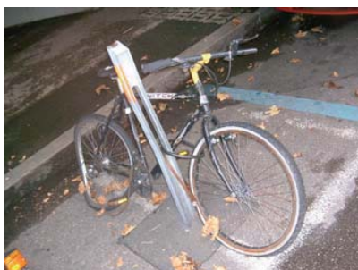
Figure 7: Epave (rue Ste-Clotilde, Juillet 2007)

Les épaves occupent un nombre important de places, ce qui est néfaste à l'image du stationnement (voir Figure 7 et 8). Alors qu'on constate une pénurie de stationnement vélo, il paraît absurde qu'autant de places précieuses soient occupées par des épaves. Pourtant, il n'y a pas d'enlèvement systématique de celles-ci. Aujourd'hui, mis à part quelques opérations ponctuelles (comme celle du printemps 2007 à la gare), les épaves sont évacuées au cas par cas. De plus, PRO VELO Genève n'est jamais informée à temps des opérations d'envergure comme celle de la gare, ne peut prévenir ses membres, et reçoit donc systématiquement des courriels de cyclistes mécontents, car leur vélo a été enlevé !