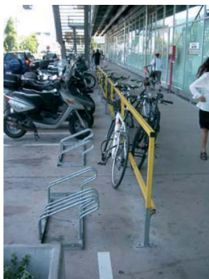
Figure 4: Les « serre-roues » ne sont pas utilisés (M-Parc La Praille juillet 2007)

Enfin, des aménagements ne permettant pas d'attacher les vélos sont une fausse solution : de tels emplacements ne sont pas utilisés par les cyclistes :