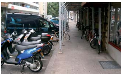
Figure 3: Cases deux-roues sans épingles et vélos attachés aux échafaudages sur le trottoir. (rue Prévost-Martin, juillet 2007)

Il est intéressant de constater que ce phénomène est indépendant de la durée du stationnement : on le retrouve aussi bien au Bourg-de-Four (dans la rue St-Léger) et à la place des Bergues où le stationnement est principalement utilisé la journée par des personnes allant travailler, que dans des rues résidentielles comme la rue Prévost-Martin (au Nord de la place des Augustins), ou la rue du XXI décembre, où les deux-roues sont stationnés pour plusieurs jours parfois.