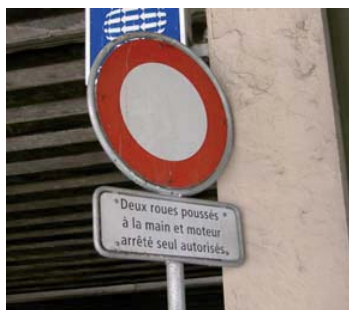
Figure 10: Accessibilité du passage des Grottes : outre le fait qu'il se situe hors des cheminements de la majorité des cyclistes, ceux-ci ne sont pas autorisés à y circuler et doivent gagner leur place en poussant leur vélo.

La proximité des quais pourrait être grandement améliorée à l'aide de trois ascenseurs reliant directement le passage des Grottes aux quais CFF :