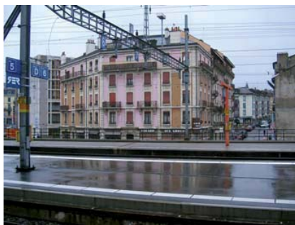
Figures 11 et 12 : Vue des quais où déboucheraient les ascenseurs. A gauche, arrivée du monte-charge du 1, Passage des Grottes.