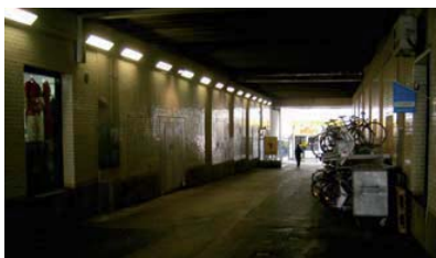
Figure 6: Passage des Grottes.