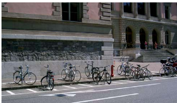
Figure 1: Les grands emplacements devraient être divisés clairement en une zone vélo, proche de la destination et une zone 2RM plus lointaine, ce qui n'est pas le cas sur la photo (rue de CANDOLLE, devant Uni-Bastions, Juillet 2007 soit pendant les vacances universitaires).

Concernant la cohabitation entre vélos et 2RM (deux-roues motorisés) sur les emplacements, deux cas doivent être différenciés : les petits emplacements de proximité (rue résidentielle, petits commerces) d'une part, doivent pouvoir accueillir à la fois des vélos et des 2RM sur l'ensemble de l'emplacement, par exemple avec des épingles espacées de 1m. D'autre part, sur les grands emplacements (lieux de formation, équipements publics, centre commerciaux, etc.), l'espace devrait être divisé en une zone vélo et une zone 2RM. La zone la plus proche du lieu de destination doit être réservée aux vélos, par exemple en installant des râteliers que les 2RM ne peuvent pas utiliser.