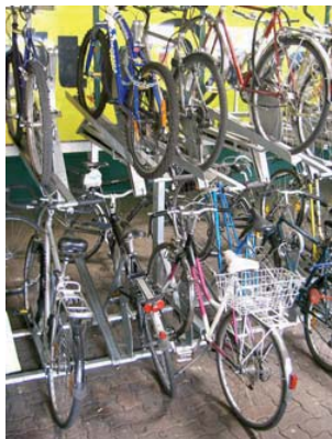
Figure 5: Râteliers à deux étages. Solution compacte, mais sensible au vandalisme, peu tolérante aux vélos non-conformes (trop grands, avec paniers ou sièges enfants).

Cependant, les râteliers du haut sont assez sensibles au vandalisme : une fois ouverts, il suffit de peu de force pour les plier. Attacher son vélo au râtelier inférieur demande quelques contorsions, voire de garder le casque pour éviter de se cogner au râtelier supérieur... De plus, si les vélos du bas sont mal garés (ce qui est souvent le cas étant donné l'accessibilité rendue difficile par l'étage supérieur), il n'est plus possible de descendre les supports du haut. Enfin, il est pratiquement impossible (en tous cas déconseillé!) de stationner un vélo avec un panier ou un siège enfant, ni à l'étage inférieur, ni supérieur.