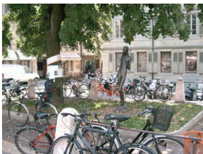
Figure 2: Puisque les cases deux-roues (au fond) sont dépourvues d'épingles, les vélos sont attachés au mobilier urbain (Bourg-de-Four, juillet 2007)

Lorsque les places de stationnement deux-roues sont uniquement marquées au sol, il n'est pas possible pour un cycliste d'attacher son vélo à un point fixe, ni de l'appuyer contre une structure solide. Dès lors, ces places ne sont pas utilisées par les vélos : seuls des deux-roues motorisés y sont garés, et les cyclistes doivent attacher leur vélo à une barrière, un poteau, un échafaudage, etc. Même si un tel stationnement peut être légal si un espace de 1m50 reste libre, l'effet de désordre qui en résulte est inesthétique pour tous (commerçants, touristes, etc.) et peut donner un sentiment d'insécurité pour le cycliste qui hésite à y laisser son vélo.