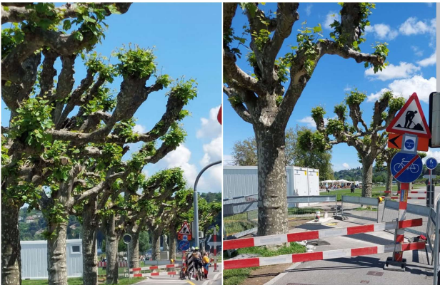
Quai Gustave-Ador, mai 2024