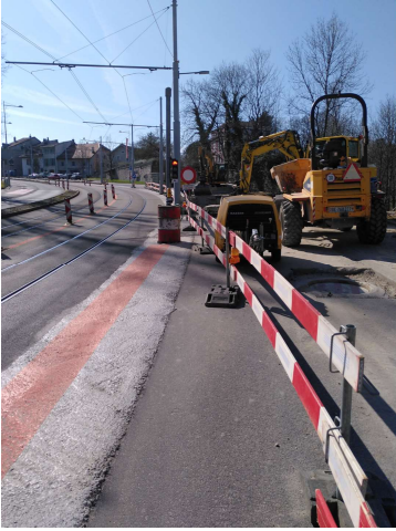
Route du Grand- Lancy, Janvier- juin 2025