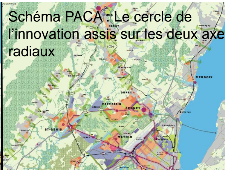
Schéma d'agglomération 2: différentiation des centralités selon l'approche du Cercle de l'Innovation

Schéma PACA : Le cercle de l'innovation assis sur les deux axes radiaux