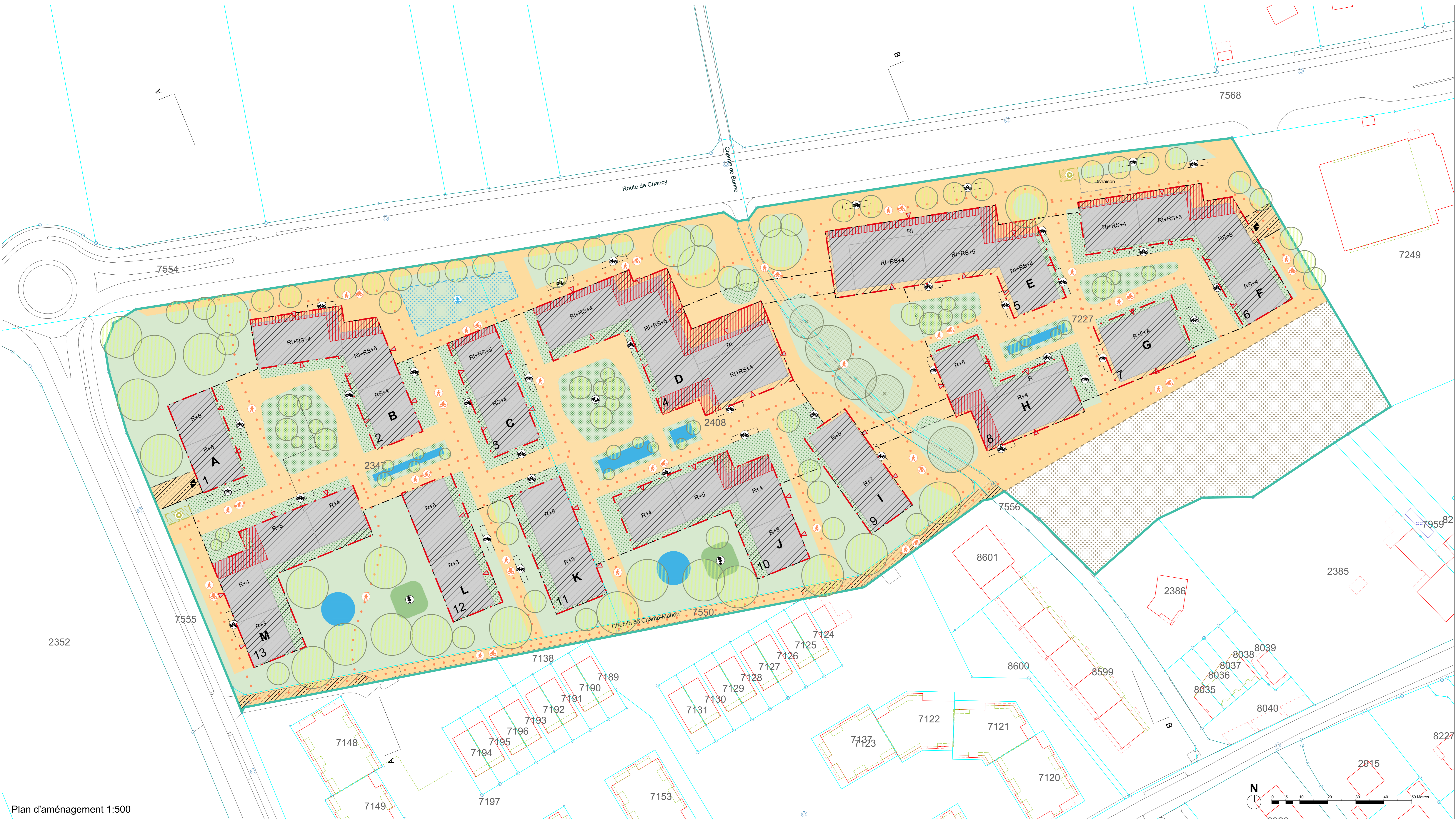
Plan d'aménagement 1:500