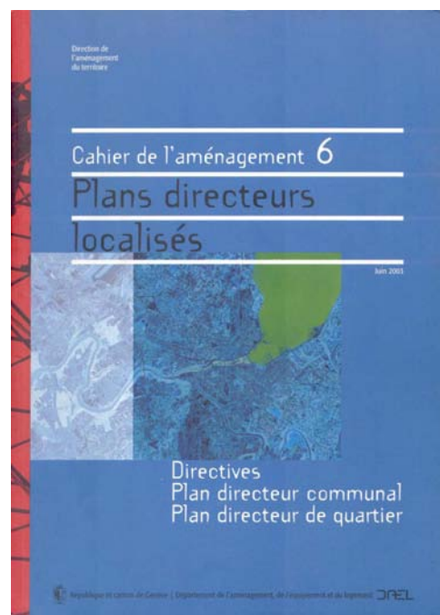
Guide des plans directeurs localisés, DAEL 2003

Ainsi, si le rôle premier d'un plan directeur communal est d'assurer la coordination entre des démarches de natures diverses ayant des incidences sur le territoire, il est surtout l'occasion pour la commune d'élaborer et de mettre en discussion une vision d'avenir, qui se traduira par une image directrice et sera accompagnée d'un plan d'actions échelonnées dans le temps.