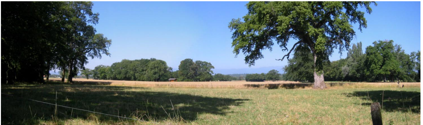
Vues de la mairie et de la campagne de Presinge

Le cahier des charges du projet de plan directeur élaboré par les autorités de Presinge précise les principaux axes sur lesquels la politique communale s'appuiera dans les années à venir: