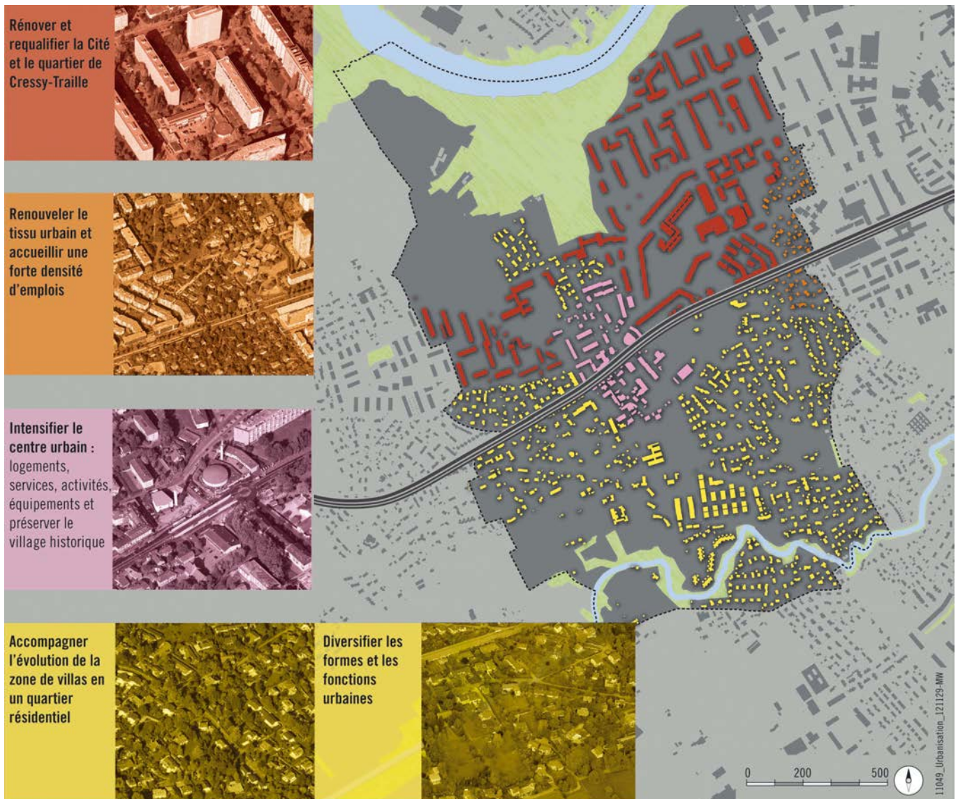
Figure 15 : Une ville composée de quartiers différenciés

5 territoires de projets ont été identifiés.