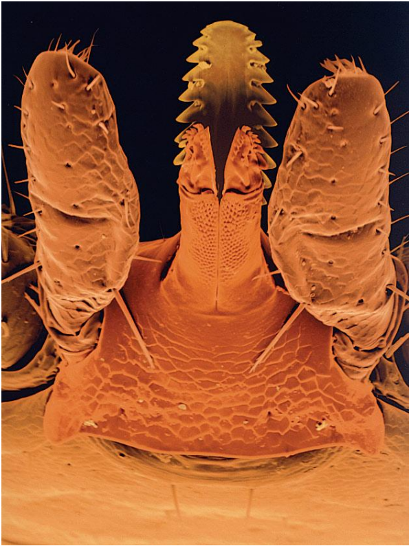
Figure 3 : Rostre de tique