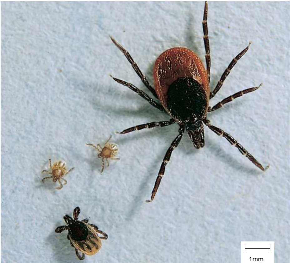
Figure 2 : Ixodes ricinus (tique) : différents stades de développement de la tique Larves (au milieu à gauche) Femelle adulte (à droite) Nymphe (en bas à gauche)