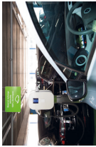
Borne de recharge électrique

La Fondation a mis en service 37 bornes connectées, réparties dans 18 parkings publics, qui viennent s'ajouter aux 37 bornes existantes. Celles-ci sont progressivement remplacées par des bornes de nouvelle génération. Les 134 points de recharge permettent de répondre à une demande grandissante.