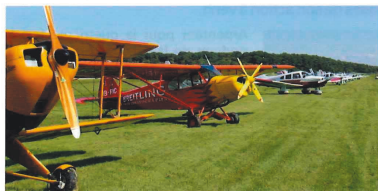
Exposition d'avions lors de la manifestation organisée par l'Aéro-club le 24 septembre 2017