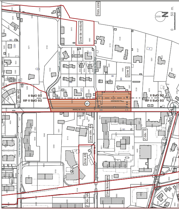
PLAN N°29779 MODIFIANT LES LIMITES DE ZONES