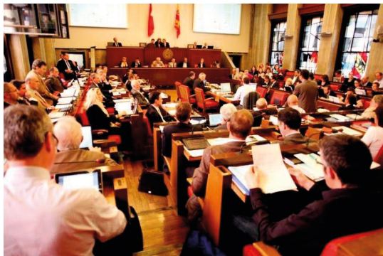
Séance du Grand Conseil sur le budget 2013.

Grand Conseil Suite à l'augmentation du coût de la vie et à la fiscalisation prochaine des jetons de présence, les parlementaires genevois décident d'augmenter leur valeur de 25%.