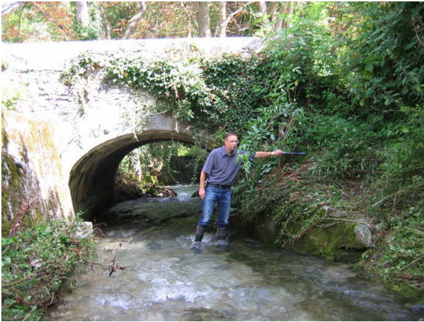
Indication de la hauteur d'eau atteinte par la rivière au niveau du pont Le chenal de décharge prévu par le projet passera à droite du pont