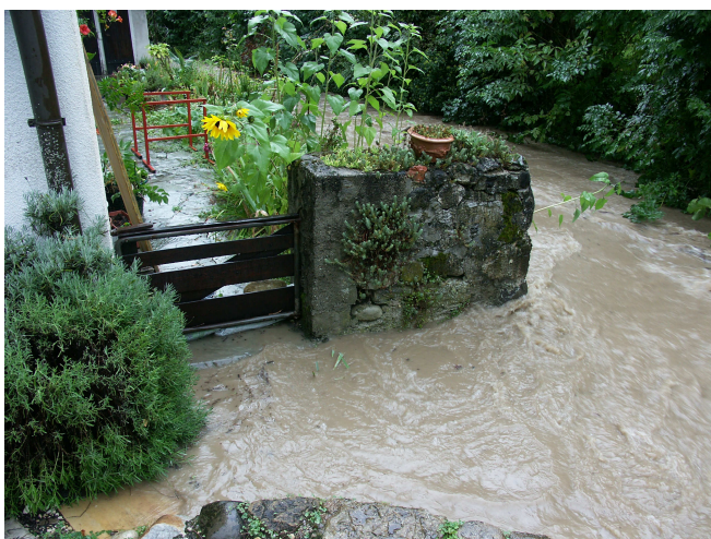
Crue de la Drize du 6 septembre 2011, en amont du pont du ch. Jacques Ormond