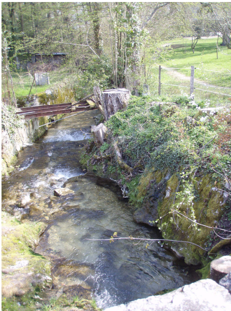
La Drize en aval du pont avec la parcelle 10950 où est prévue l'arrivée du bras de décharge (photo prise depuis le pont)