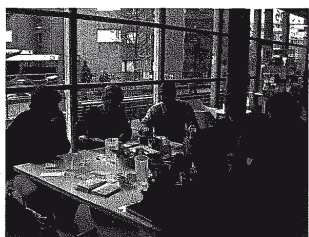
Le groupe de travail "Pavillon Cayla" se réunit à la Maison de Quartier de saint-Jean un mercredi à midi par mois

« À l'angle de l'avenue d'Aire et du chemin William-Lescaze, une maison titille ma curiosité depuis longtemps. Rescapée des bulldozers, elle semble surgir d'un conte de Grimm. Son délabrement tranche avec la modernité du Cycle de Cayla, juste à côté. Maison hantée par les fantômes de la République? Repaire de la dernière sorcière urbaine? Je me pointe dans le secteur. Abandonnée de Dieu et des hommes, l'habitation a tout d'une île au milieu d'un océan d'immeubles. Ses fenêtres sont condamnées et ses murs recouverts de végétation. En friche, son jardinet recèle plein de petits bonheurs: un poirier, des mûriers, des fraises des bois et des chardons mauves. ... C'est en 1892 que ce pavillon Cayla a été construit ... Au Département des constructions, on m'informe qu'il compte aujourd'hui se séparer de cette poétique parcelle... Cette demeure ancestrale résistera-t-elle à la marche du temps? Pour l'heure, seuls les fantômes et les sorcières ont la réponse. »